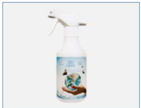
有効塩素濃度300ppmシリーズ