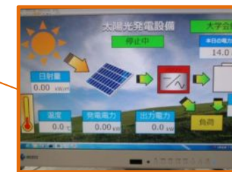
見える化システム