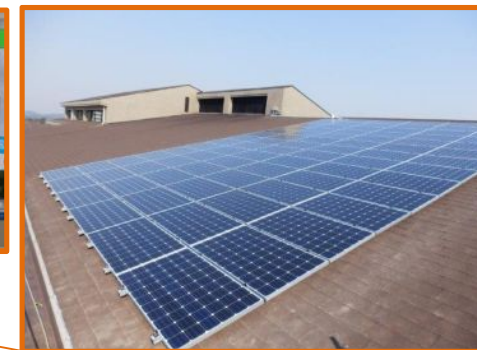
大学会館 太陽電池容量: 21.8kWp