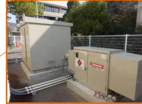
体育館 エンジン発電機: 30kVA