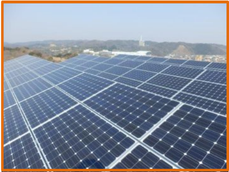
本部共通棟 太陽光発電容量: 21.8kWp