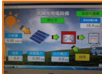
見える化システム