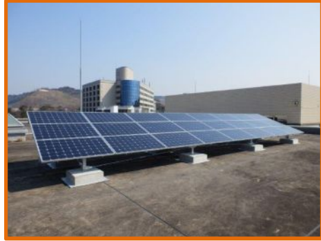
図書館 太陽光発電容量: 6.0kWp

概要：和歌山大学栄谷団地各建物に発電設備(発電機+自然エネルギー)と蓄電池設備の整備