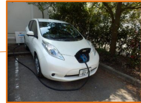
体育館 日産リーフ: 24kWh × 2台 蓄電池設備容量: 48kVAh