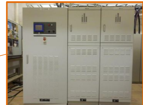
大学会館 蓄電池設備容量: 29.4kVAh