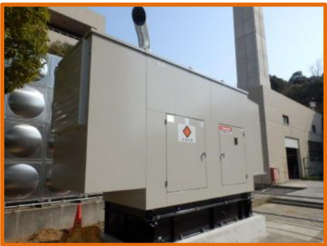
本部共通棟 エンジン発電機: 300kVA