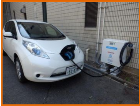
設備棟 日産リーフ: 24kWh × 2台 蓄電池設備容量: 48kVAh